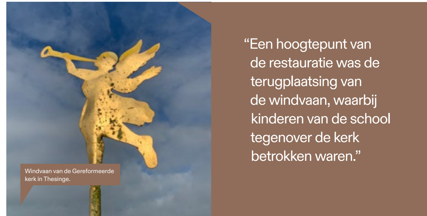
Windvaan van de Gereformeerde kerk in Thesinge.

De Nationaal Coördinator Groningen (NCG) heeft relatief eenvoudige versterkingsmaatregelen uitgevoerd aan de kerken van Wirdum, Oosterwijdwerd en de Gereformeerde kerk in Thesinge, waardoor deze kerken nu voldoen aan de gestelde normen.