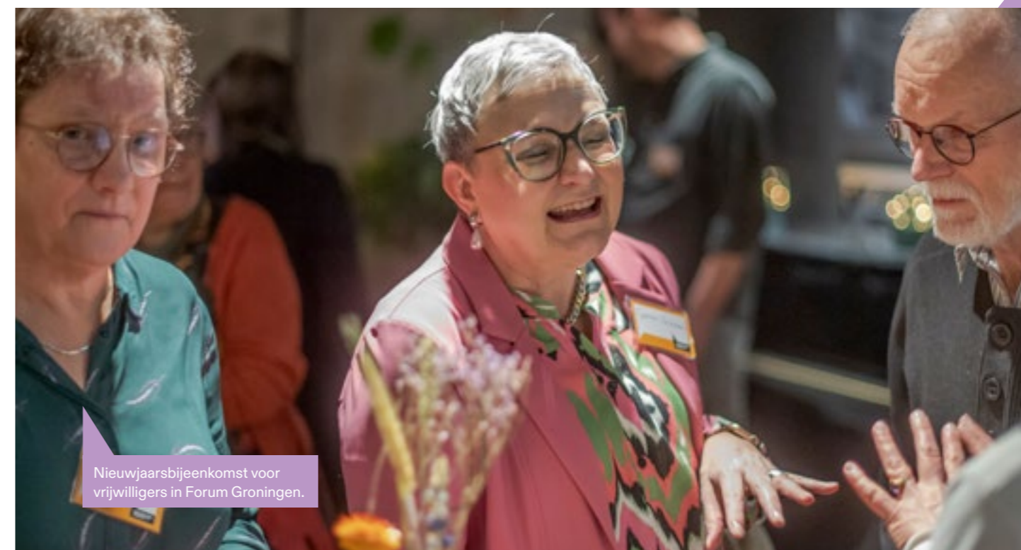
Nieuwjaarsbijeenkomst voor vrijwilligers in Forum Groningen.

“Om goede contacten tussen het Vrijwilligersplatform en vrijwilligers te bevorderen, worden de platformvergaderingen vanaf 2022 op steeds wisselende locaties gehouden”