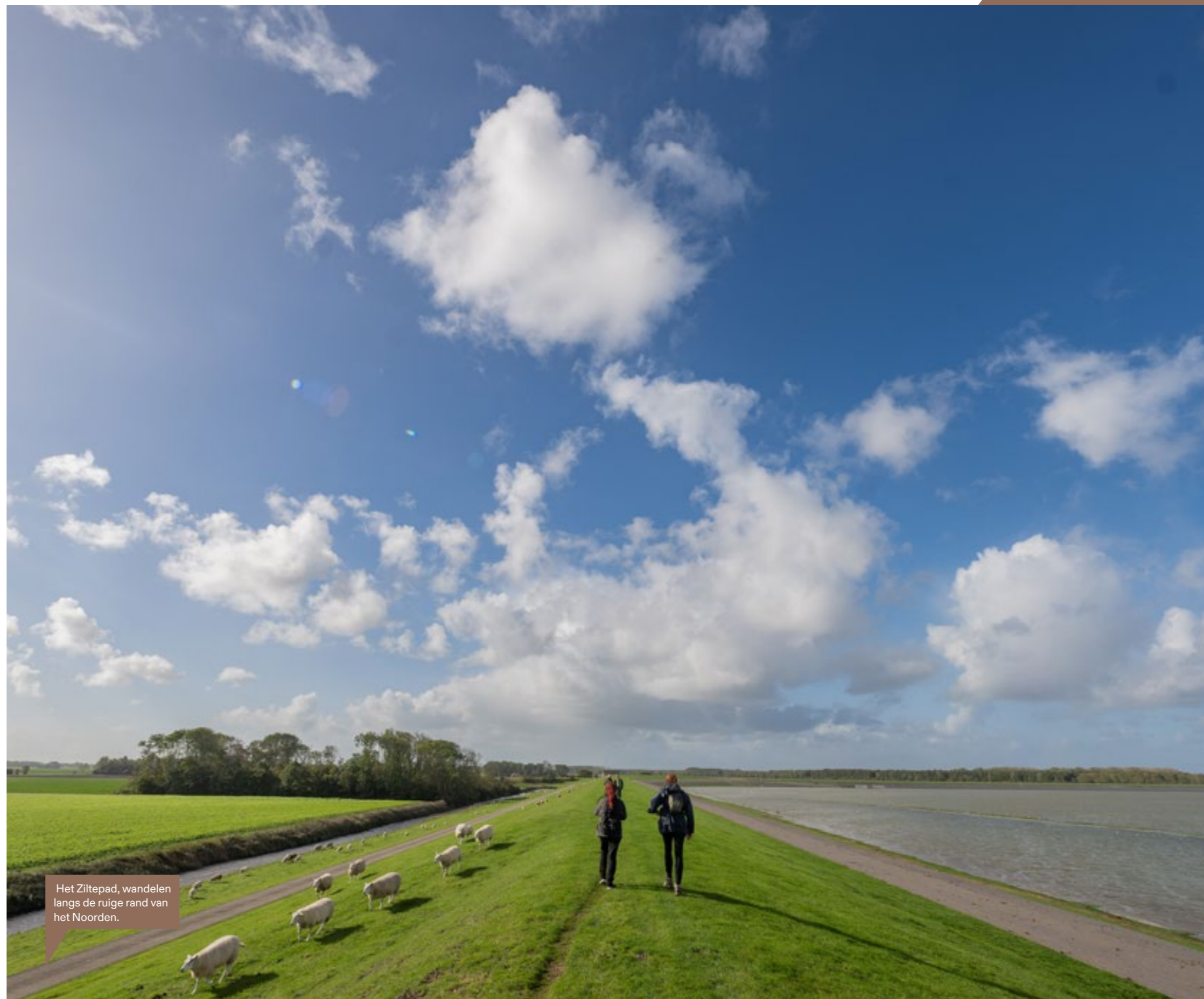
Het Ziltepad, wandelen langs de ruige rand van het Noorden.