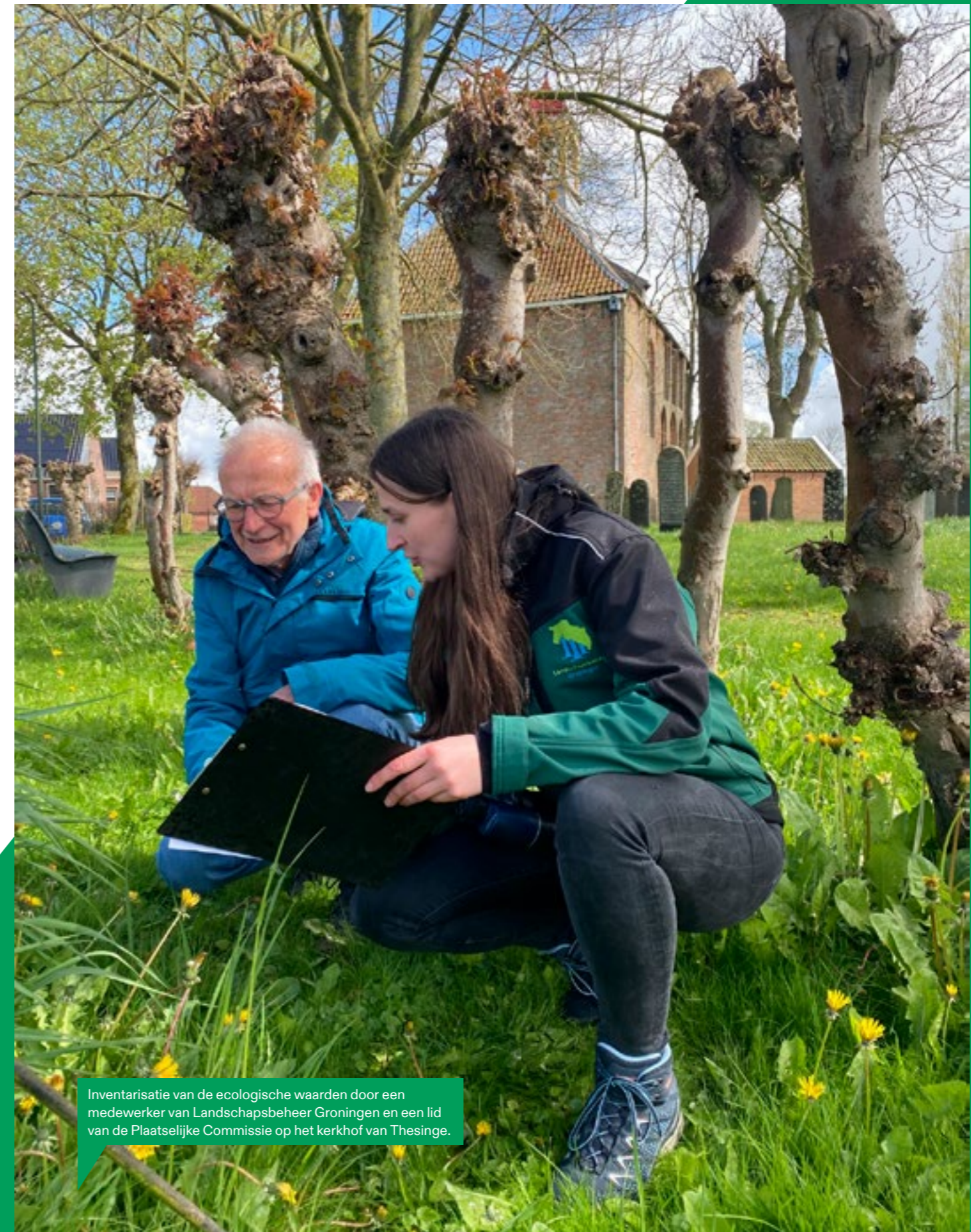
Inventarisatie van de ecologische waarden door een medewerker van Landschapsbeheer Groningen en een lid van de Plaatselijke Commissie op het kerkhof van Thesinge.

In het najaar van 2023 zijn 15 essen gekapt op het kerkhof van Woltersum. Alle 29 essen op het kerkhof waren aangetast door essentaksterfte. Door de gemeente Groningen zijn voor 13 essen kapvergunningen afgegeven. Tijdens het kappen bleken nog eens twee essen dusdanig slecht dat ze met spoed moesten worden gekapt. De overige bomen op het kerkhof zijn gesnoeid. Volgens de herplantplicht is er voor de gekapte bomen een aanplantplan opgesteld door een extern bedrijf. Deze bomen zullen in het voorjaar van 2024 worden aangeplant.