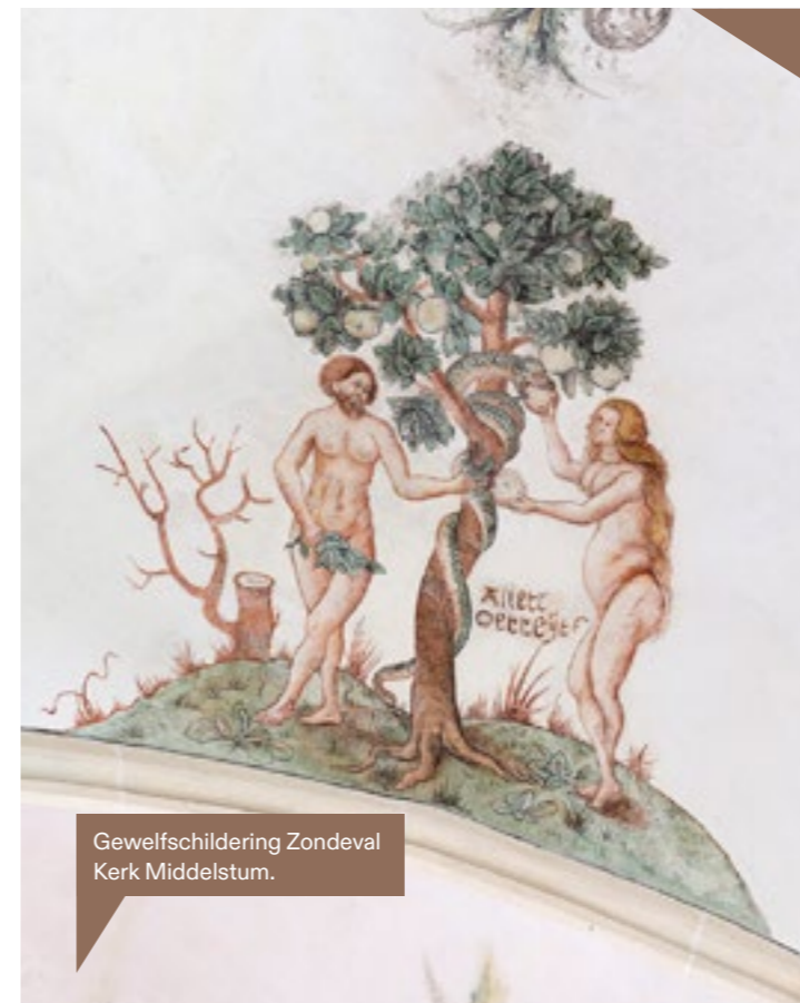
Gewelfschildering Zondeval Kerk Middelstum.

“Toch had elk object zijn eigen verhaal, zijn eigen geschiedenis, en was het op zijn eigen manier van onschatbare waarde.”