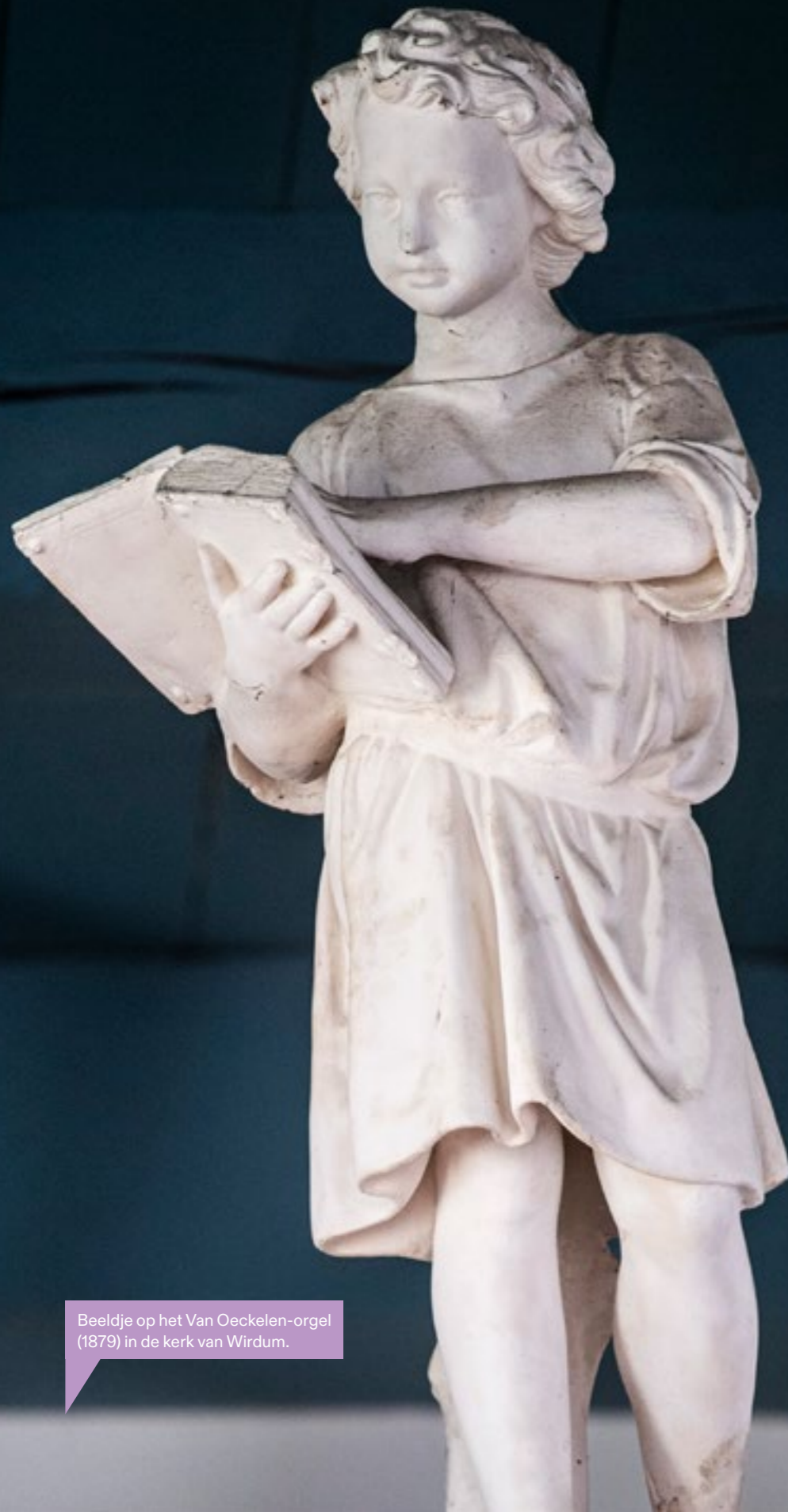
Beeldje op het Van Oeckelen-orgel (1879) in de kerk van Wirdum.

De beleggingen in onroerend goed betreffen woningen en pastorieën, verkregen als deel van de overnamesom, dan wel uit een nalatenschap. De objecten worden als beleggingsobject aangehouden en tegen marktconforme condities verhuurd.